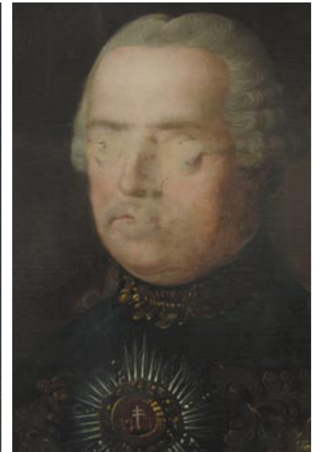
Portrét neznámého šlechtice, stav po restaurování

Příklady z návrhů alternativního řešení portréru: