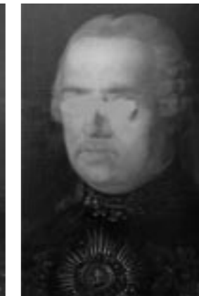
Partie očí v zatónovaném tmelu