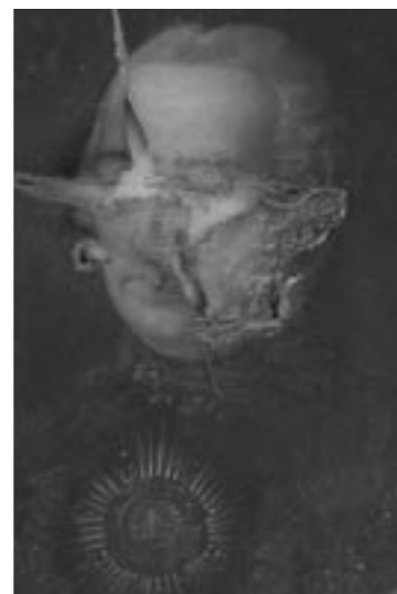
Stav před restaurováním

Plátno bylo protrženo v obličejové části, kde došlo k jeho dramatickým deformacím a ztrátě barevné vrstvy. Toto poškození silně znesnadňovalo čitelnost malby, a to i po provedení restaurátorského průzkumu (nedestruktivní VIS, IR, UV, RTG, sondážní, chemicko-technologický) i po pozdějším vyrovnání plátna. Zcela absentovaly tvary očí, těžce poškozené byly partie nosu, úst a levé tváře. Ke ztrátám barevné vrstvy došlo i v pozadí zejména po obvodu malby na místech protlačeného napínacího rámu. V této části barevná vrstva střechovitě odstupovala od podkladu a tvořila „puchýřky“. Původní barevnou vrstvu pokrývala vrstva ztmavlého laku s depozitem.