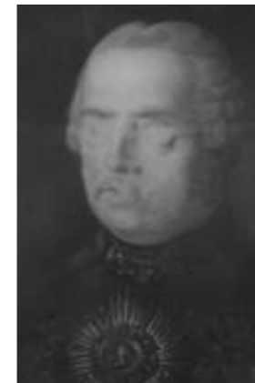
Stav po restaurování