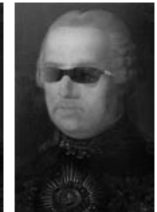
Renovace, tj. zhodnocení památky novým uměleckým činem...

V úvahu bylo nutné vzít i skutečnost, že malba je majetkem SNG – Červený Kameň, a jako taková by měla splňovat základní požadavky vystavovatelnosti. V tomto případě to znamená hlavně to, že obraz jako sbírkový předmět SNG může být kdykoli vystaven a tudíž jeho konečná podoba by měla být prezentovatelná i laické veřejnosti.