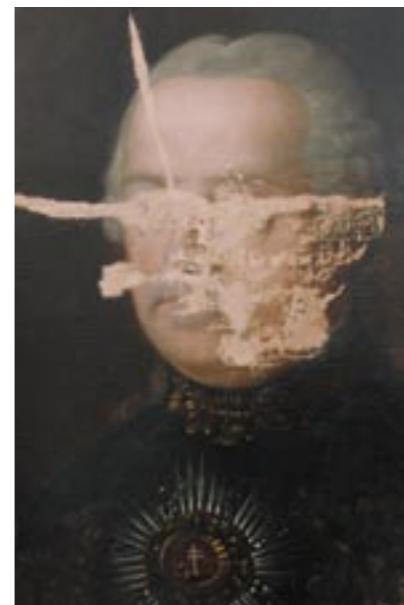
Hlavní defekty ve tmelu zatónovaném do barvy podkladu

Příklady z návrhů alternativního řešení portréru: