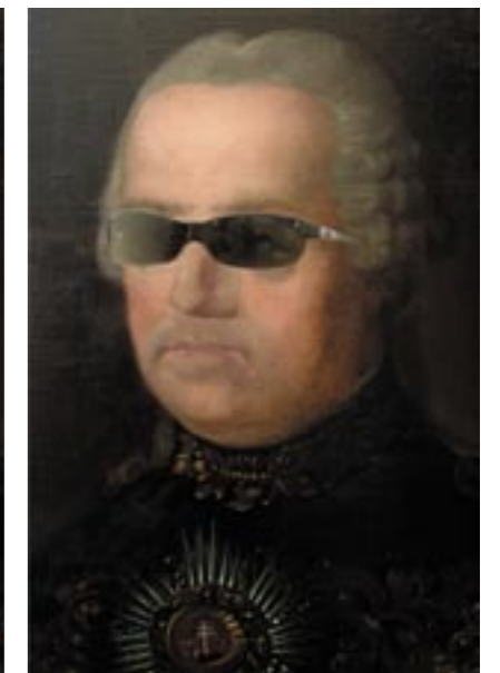
Renovace, tj. zhodnocení památky novým uměleckým činem...