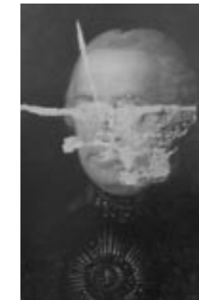
Hlavní defekty ve tmelu zatónovaném do barvy podkladu