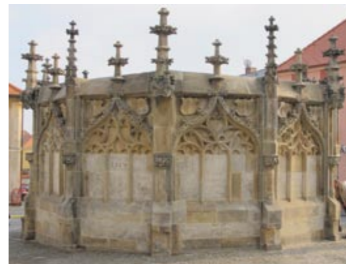
Stav po restaurování, 2011

Jedním ze zásadních argumentů pro užití konzervační metody je princip možnosti rekonzervace. Pokud se podíváme na historii restaurátorských zásahů na kamenných objektech v exteriéru, tak uvidíme, že se intervaly mezi jednotlivými restaurátorskými zásahy postupně zkracují. Je tedy nezbytné provádět restaurátorský zásah nikoli pro okamžik kolaudace díla, ale s vědomím, že v horizontu 15–20 let bude nutné restaurování opakovat. Pokud bychom museli v tomto intervalu pokaždé přistoupit k restaurování Kamenné kašny v takovém rozsahu, v jakém to bylo nutné při této opravě, bylo by to nejen neekonomické, ale po několika desítkách let by už nebylo co restaurovat.