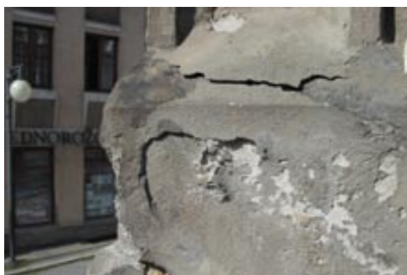
Stav před restaurováním, 2010 – rozpad kamene pod tmely