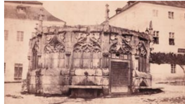
Archivní fotografie A. Groll, 1856 – stav před puristickou rekonstrukcí

Z hlediska dnešního vnímání je zásadní oprava provedená v 90. letech 20. století. Tato oprava byla v odborných kruzích kladně hodnocený zásah pro svou „odbornost a vysokou úroveň restaurování“. 4 Tato oprava byla poměrně rozsáhlá a trvala (snad