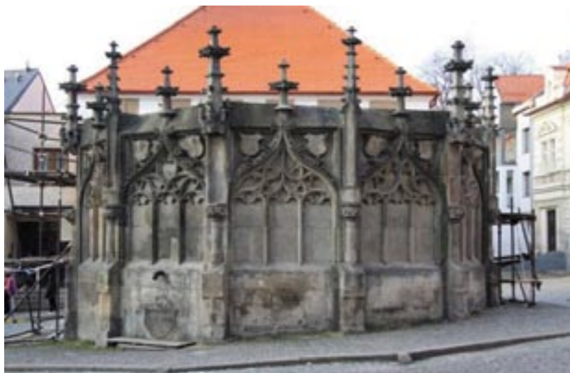
Stav před restaurováním, 2010