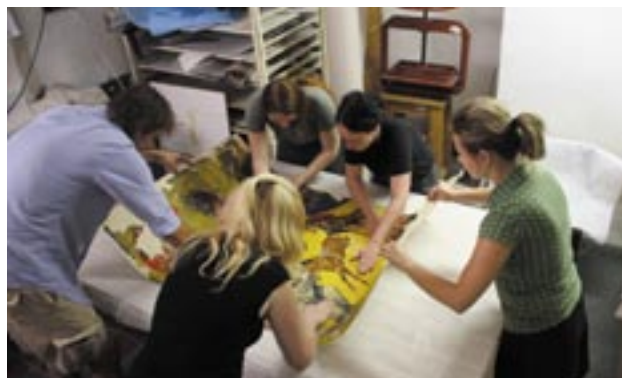
Kaširování plakátu na plátno.