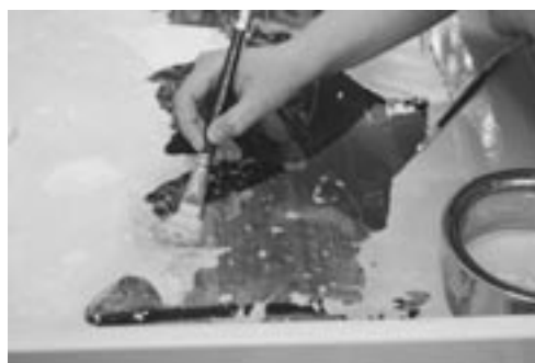
Čištění pomocí vodných systémů.