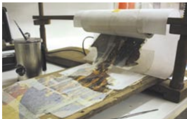
Snímání částí plakátu z prken.