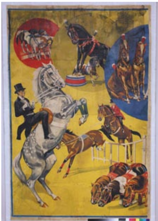
Stav plakátu po restaurátorském zásahu.