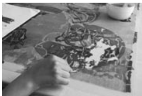
Retuše chybějící barevné vrstvy.