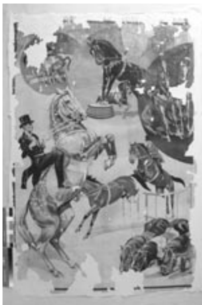
Stav plakátu po doplnění chybějících míst papírovou suspenzí.