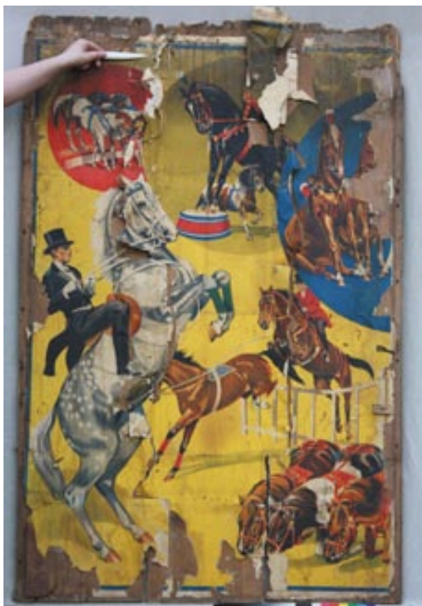
Stav plakátu před restaurátorským zásahem.