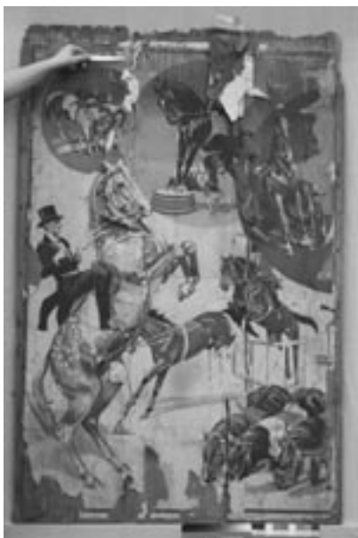
Stav plakátu před restaurováním.

Poškození papírového nosiče je chemického i fyzikálně mechanického charakteru. Objekt vykazuje silné mechanické znečištění, mikrobiologické poškození a kyselost papírové podložky. V důsledku nevhodné manipulace došlo k výrazným trhlinám a ztrátám. Horní část plakátu je v důsledku zatékání vody zeslabená a dochází zde ke křehnutí papíru. Vlivem velmi nevhodného podlepení došlo k lokálnímu prosáknutí lepidla na lícovou stranu. Celkově byl objekt pomačkán s četnými puchýřky. Dále jeho povrch vykazuje stopy po včelích plástech.