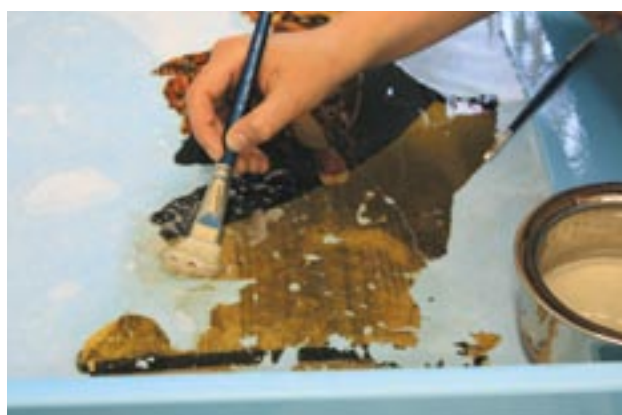
Čištění pomocí vodných systémů.