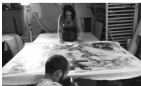
Napínání plakátu na rám.