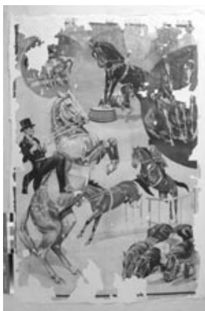
Stav plakátu po doplnění chybějících míst papírovou suspenzí.