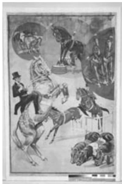
Stav plakátu po resturování.