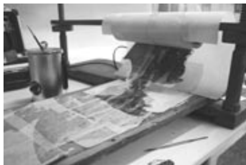
Snímání částí plakátu z prken.

Obrazová dokumentace v barevné příloze na straně 51.