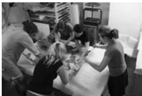
Kaširování plakátu na plátno.